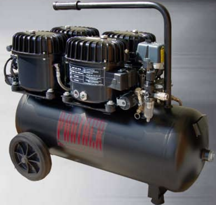
P150 / 50AL