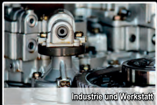
Industrie und Werkstatt