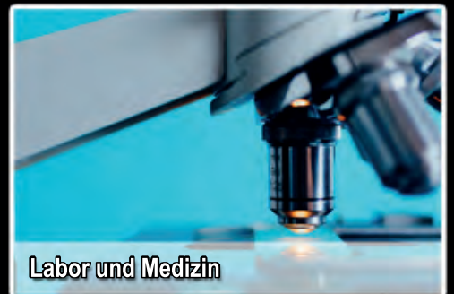
Labor und Medizin